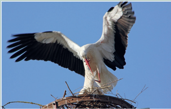
Dies ist ein Storchenpaar. Störche sind ihrem Partner und dem Nistplatz treu.