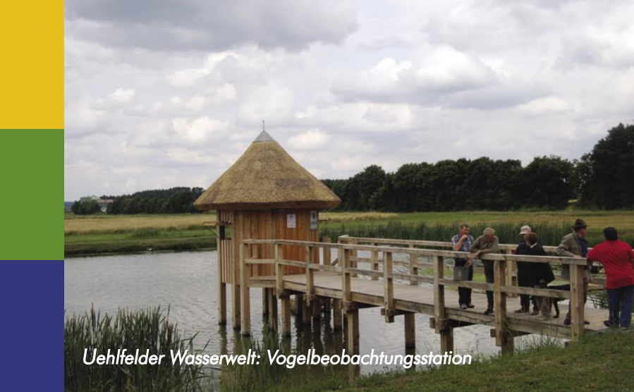
Uehlfelder Wasserwelt: Vogelbeobachtungsstation

Tip: Der familienfreundliche Kräuterrundweg lässt sich auch ausgezeichnet mit dem Aischtalradweg und dem Uehlfelder Karpen-Rundweg verbinden. Weitere Spaziergänge, Wandertouren und längere Radausflüge werden so möglich.